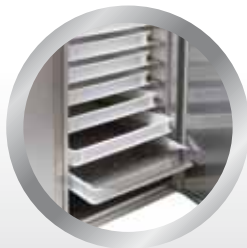
odstranljivo dno predala a removable bottom, press